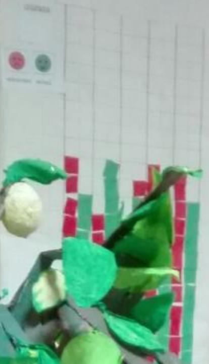
GRAFICO DEL GRADIENTI