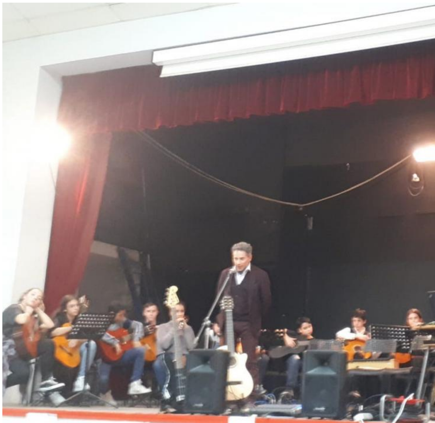
Leggi tutto ... Concerto di fine anno e saggi di strumento Pubblicata il 23/05/2019