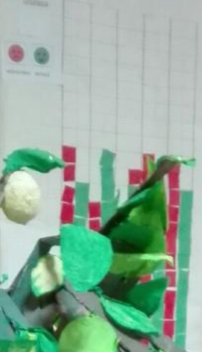
GRAFICO DEL GRADIENTI