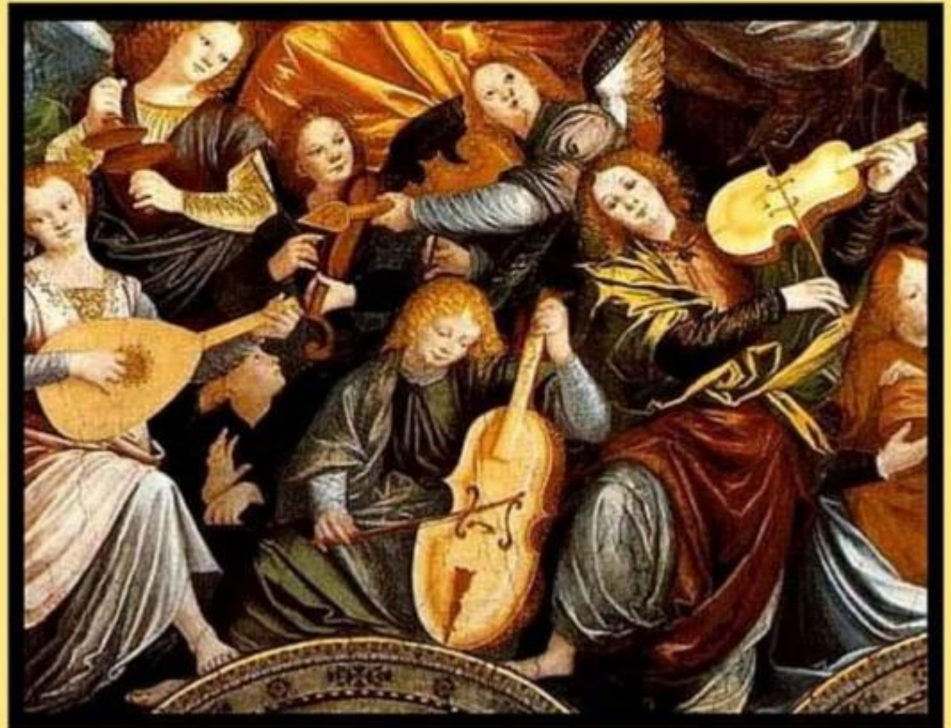
Coro degli Angeli musicanti, Saronno, santuario della Beata Vergine dei Miracoli (Gaudenzio Ferrari 1475-1546)