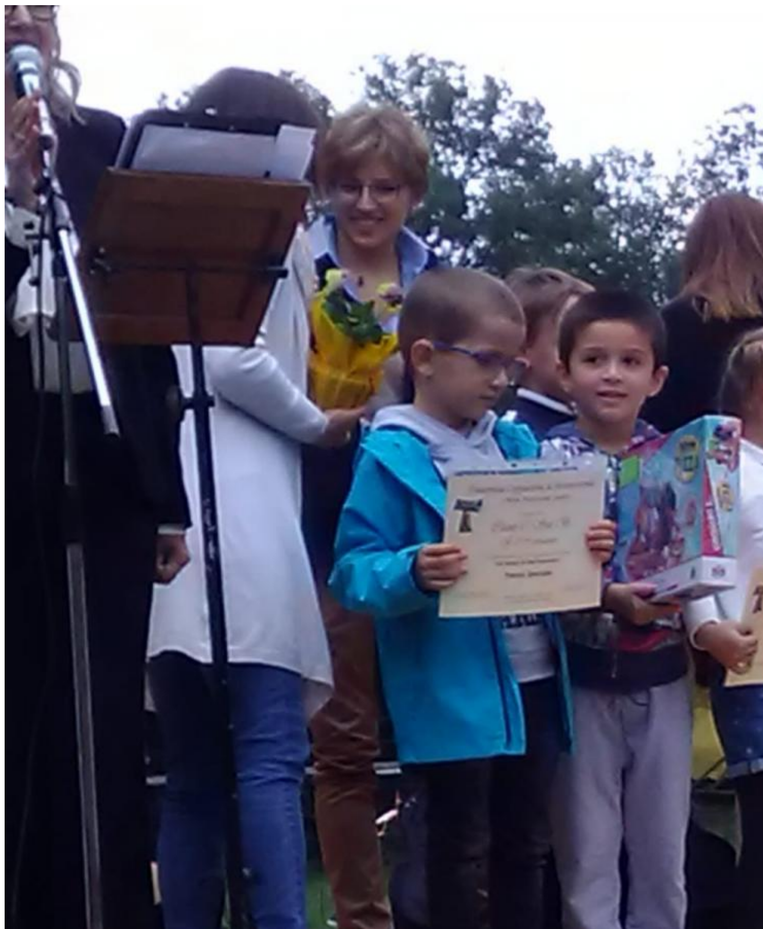
Ancora altri premi alle classi I e II della Scuola Primaria