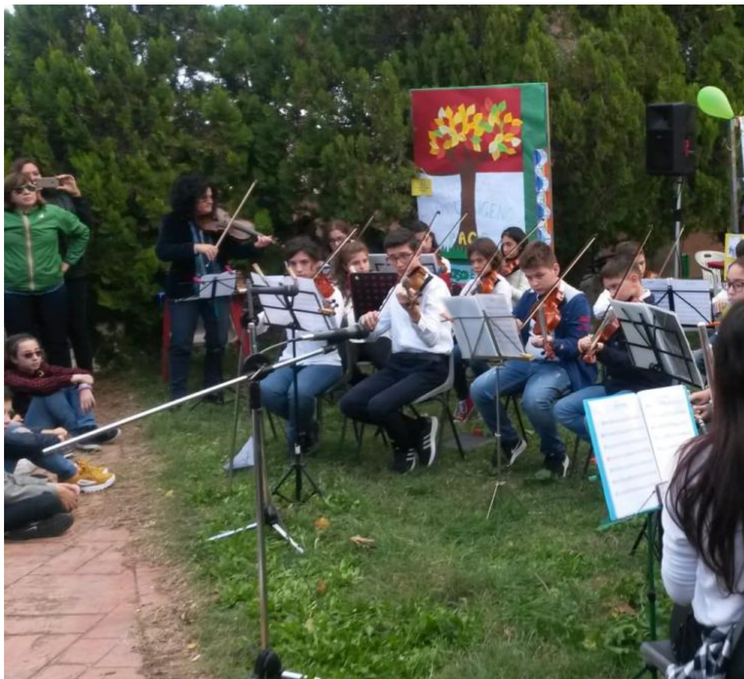
L'Orchestra dell'Istituto L. Campanari in " Dolce Sentire " di R. Ortolani e " Te Deum" di M.A. Charpentier.